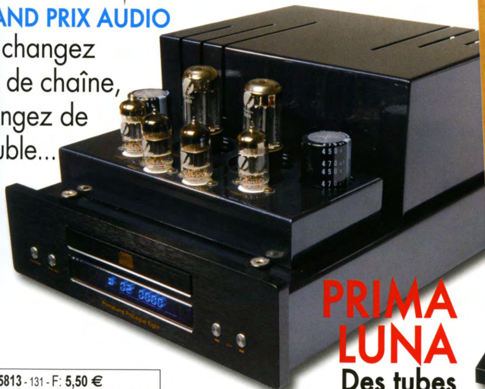
PRIMA LUNA Des tubes dans le lecteur