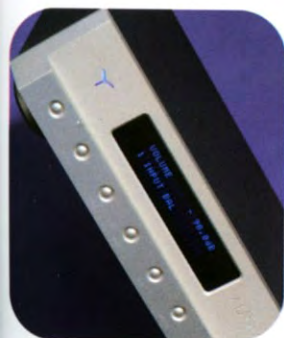
AUDIA FLIGHT PRE